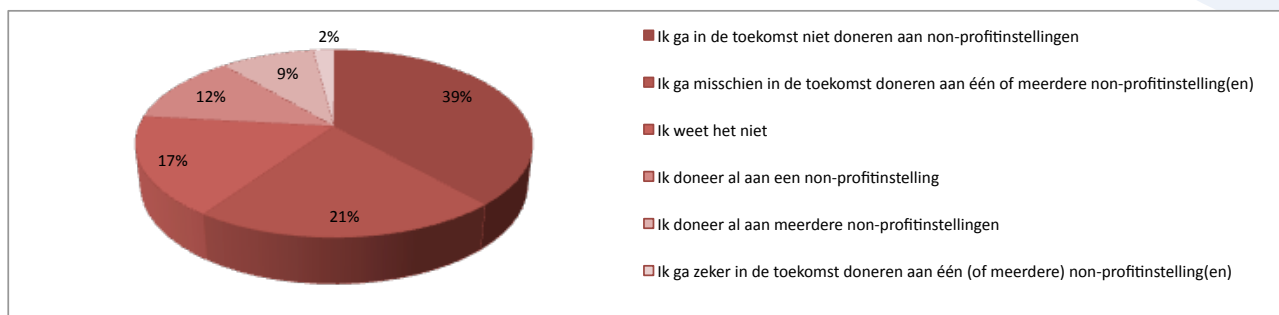
Afbeelding 2 doneren aan non-profit instellingen

Als er specifiek gevraagd wordt of men naast goede doelen ook aan één of meerdere andere non-profit instellingen doneert of in de toekomst zal gaan doneren, antwoordt meer dan een vijfde dat ze reeds aan één of meerdere non-profit instellingen doneren. Ook nog eens een vijfde geeft aan dit in de toekomst misschien of zeker te gaan doen. Een groep van 38% geeft aan in de toekomst naast aan goede doelen niet ook te gaan doneren aan non-profit instellingen en 17% geeft aan dat ze niet te weten of ze dit gaat doen (zie afbeelding 2).