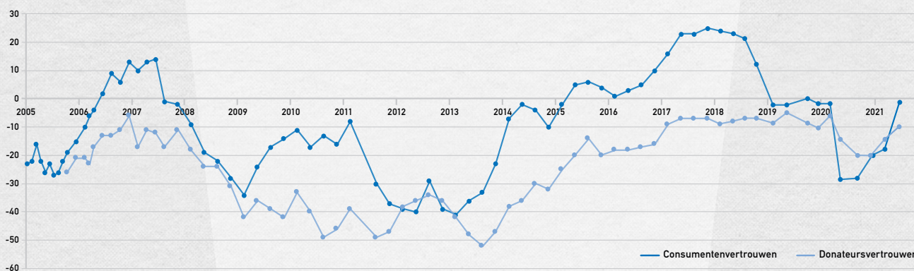
Figuur 1: Ontwikkeling van donateurs- en consumentenvertrouwen 2005-2021

Daarbij merken we op dat de verandering in het cijfer vooral te wijden is aan het beeld dat panelleden hebben over de Nederlandse bevolking. Ieder kwartaal stellen we vijf vragen aan het panel om het donateursvertrouwen te bepalen. Twee daarvan gaan over het geefgedrag van de Nederlandse bevolking. Kijkend naar het indexcijfer van deze twee vragen stijgt dit van -27 vorig kwartaal naar -17 nu.