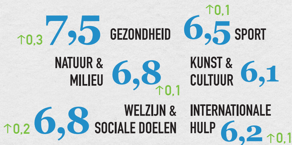
Figuur 3: Rapportcijfer per categorie

Als we kijken naar het vertrouwen in goede doelen per categorie, is dezelfde stijgende lijn te zien. Met uitzondering van de categorie Kunst & Cultuur, neemt het vertrouwen over de hele linie toe. De categorie Gezondheid wordt beloond met de grootste stijging (0,3) en de hoogste beoordeling (7,5).