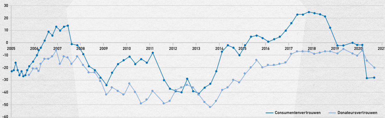
Figuur 1: Ontwikkeling van donateurs- en consumentenvertrouwen 2005-2020

De verwachte daling van het donateursvertrouwen leek in juni nog mee te vallen (van -6 naar -14). In september zien we dat het donateursvertrouwen de trend van het consumentenvertrouwen volgt. Donateurs zijn pessimistischer geworden over hun eigen geefgedrag en het geefklimaat in Nederland. Het cijfer komt uit op -20.